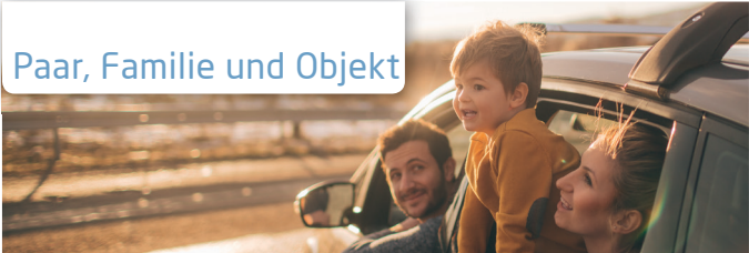
Paar, Familie und Objekt